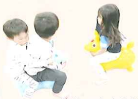
とりっこしたけど すぐ仲直り♪