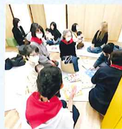
前回の交流の様子

絵本・手あそび・わらべ歌を いろいろな国の言葉で 楽しみましょう♪ だれでも参加できます。 好きな絵本があれば ぜひ持ってきてください!