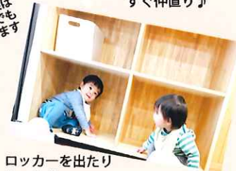
ロッカーを出たり 入ったり

3/13に松見消防出張所の方に「乳幼児家庭の防災・減災って?」のお話を聴きました。スライドを見ながらのお話に加えて、簡易トイレに水を入れ、どう固まるのかを見たりアルミのブランケットを広げたりしました。実際に試してみるのには大事ですね。資料やハザードマップはひろばで用意しています。当日参加できなかった人はぜひ手にとってみてくださいね~