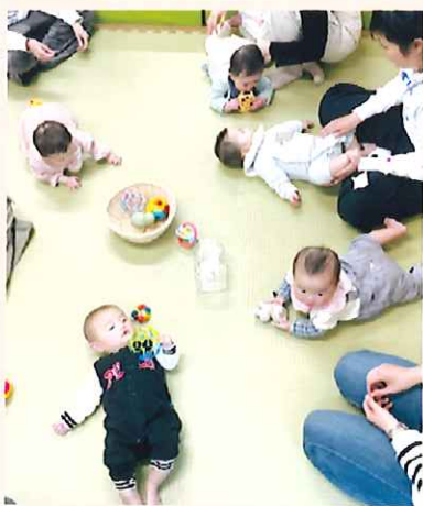
ある日の赤ちゃんコーナー