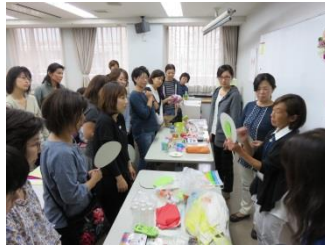
1日目 「未就学の子どもの生活と援助」