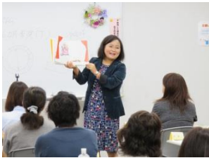
1日目「子どもの発達と生活Ⅰ」

参加者からは、「サポートにはもちろん、自分の子育てにも生かせる内容ばかりでよかったです。」等、受講後の感想をいただきました。