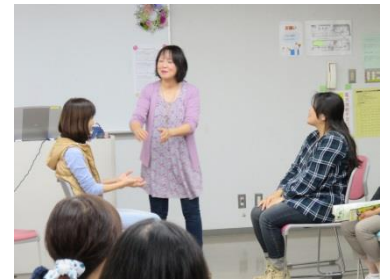
3日目 「地域における子育て支援」