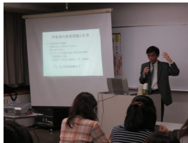
3日目 「子どもの発達と生活Ⅱ」