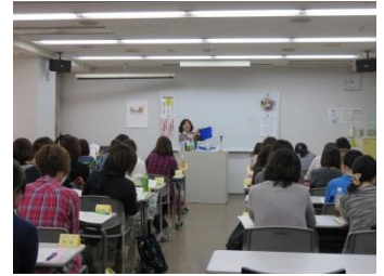
2日目 「子どもの健康管理」