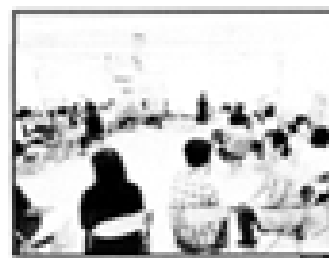
3日目：地域における子育て支援