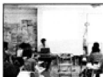
3日目：子どもの発達と生活Ⅱ