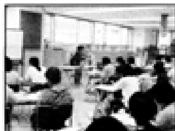
1日目：子どもの発達と生活Ⅰ