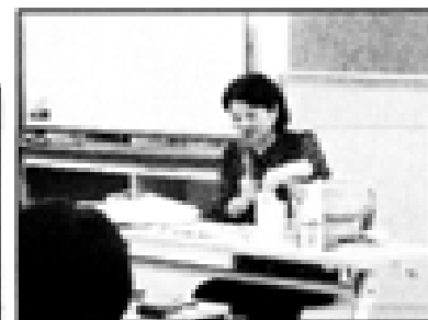
3日目：子どもの健康管理