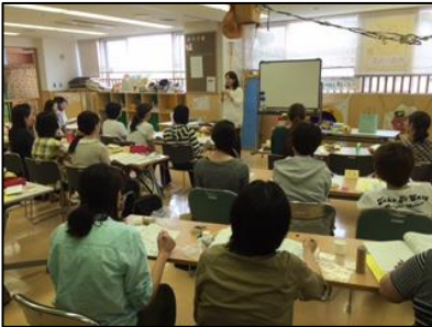
予定者研修会の様子↑

今年度も神奈川県主催の提供・両方会員予定者研修会が6月にかなーちえで行われました。3日間にわたり、35名の方にご参加いただきました。そのうち神奈川県の方は16名、神奈川県の方の中で修了された方は11名でした。 残念ながら、今年度未更新の方や退会された会員さんもおられますが、ここで少し提供・両方会員さんが増え、コーディネーター一同、嬉しく思います。 子サポの活動を無理なく、未永く、続けてくださいますよう、どうぞよろしくお願いいたします。