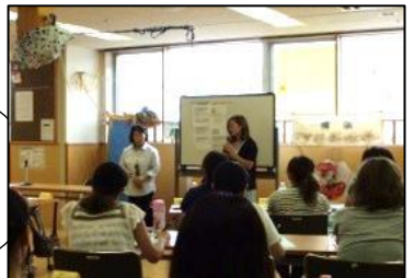
3日目 援助活動の実際 (提供・両方会員 さんのお話)