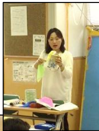
1日目 未就学の 子どもの 生活と援助